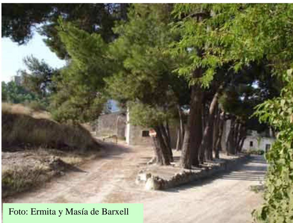
Foto: Ermita y Masía de Barxell

La salida y meta se ubican en la propia masía.