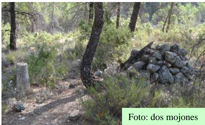
Foto: dos mojones

Los mojones vienen representados en el terreno por dos tipos: el mojón de piedra (de obra) y el mojón compuesto por un montón de piedras apilado. En este sentido el cartógrafo ha seguido el criterio de considerar como mojón el montón de piedras que se encuentra correctamente apilado y/o que tiene una paleta indicativa de coto de caza, mientras que los montones de piedras que no están del todo ordenados (aún cumpliendo con la función de dividir las fincas) los ha representado con el símbolo de piedras apiladas.