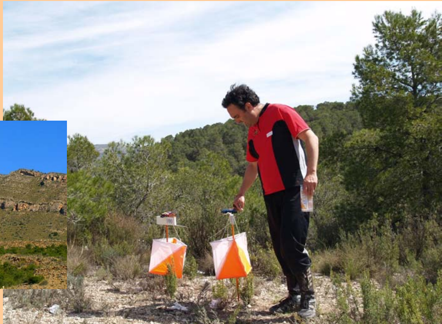
EL BEC DE L'ÀGUILA